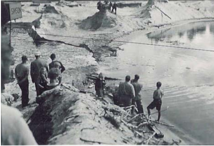
Nordsjön och Östersjön möts när kanalens sista meter försvinner 1940.