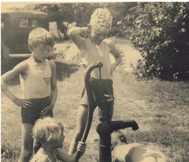
Det fanns inte rinnande vatten utan man pumpade det som behövdes i hus-håll etc