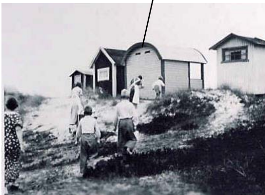
”vår” badhytt sedd från baksidan