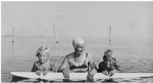
Pappa Johan köpte, troligen genom farbror Thures "Sommarboden" en surfingbräda!