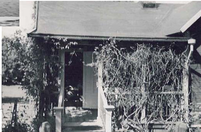
Sommarvillan sedd från Ljungsättersvägen