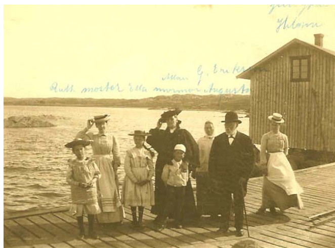
Utflykt till Kåkenäs utanför Stenungsund